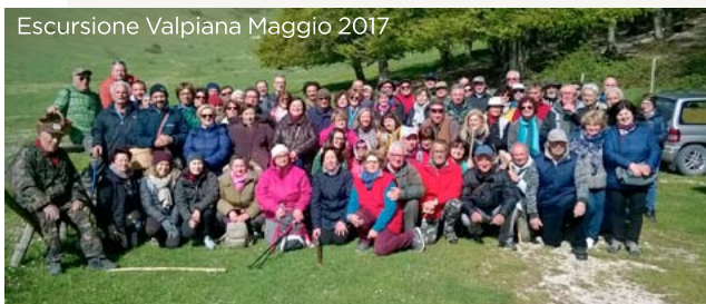
Escursione Valpiana Maggio 2017

presso Azienda BIOCOCCINELLA a Castelplanio. Ritrovo ore 08.00 distributore Total Jesi Ovest Accompagnatori: Esperti di Erbe del GMJ