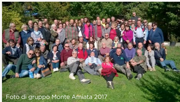
Foto di gruppo Monte Amiata 2017

Escursione micologica con auto proprie, prenotazioni in sede. Mostra Micologica "I FUNGHI DEL MONTE AMIATA" presso Hotel Parco Erosa.