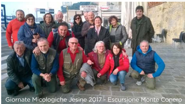
Giornate Micologiche Jesine 2017 - Escursione Monte Conero