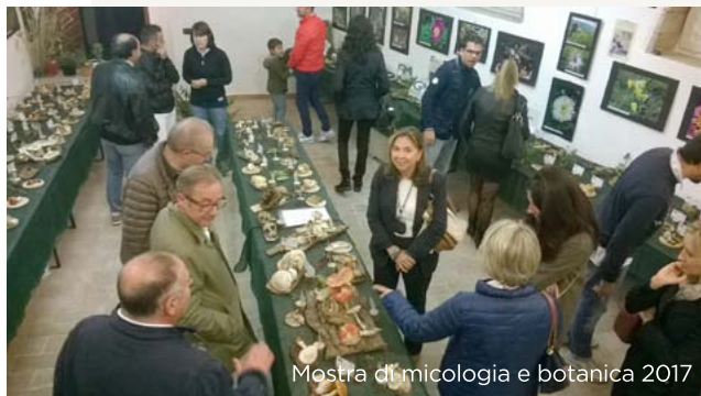
Mostra di micologia e botanica 2017

Escursioni, studi, conferenze con la partecipazione di autorevoli micologi di fama nazionale ed internazionale.